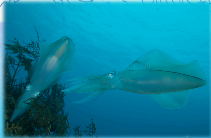
アオリイカが卵を産みに集まってくる