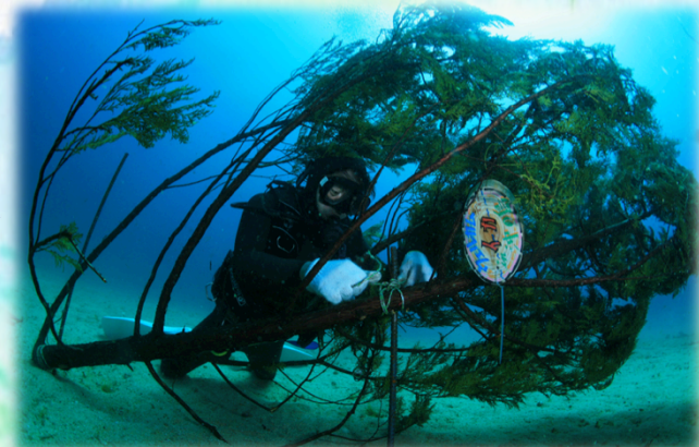
ダイバーが海底に産卵床を設置