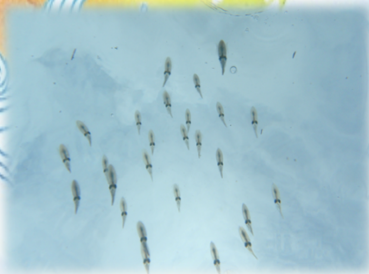
柏島の海にイカが増える！