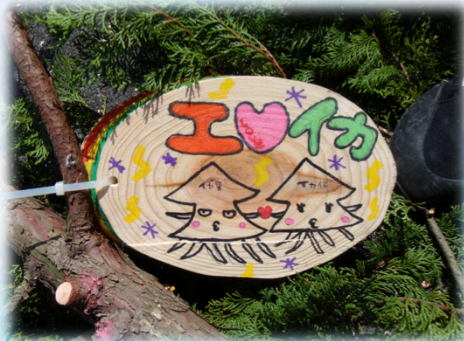
メッセージプレートに記入