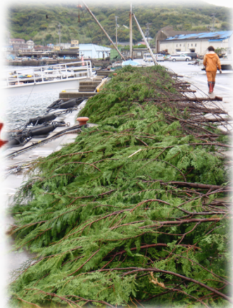
産卵床を購入する