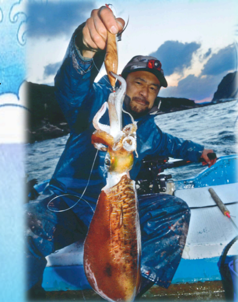
漁師さんが釣ったアオリイカと海中写真をお届け